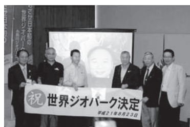
日本初の世界ジオパークに認定される