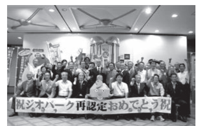
世界ジオパークに再認定される