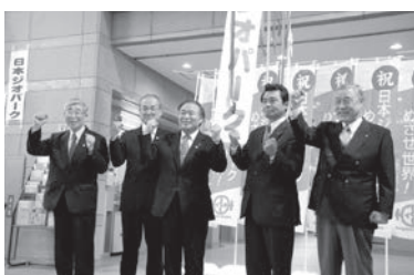
日本ジオパークに認定される